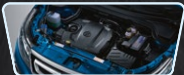
Motor 1.5 Turbo