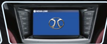
Pantalla táctil 7" a color