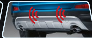
Sensor de retroceso + cámara